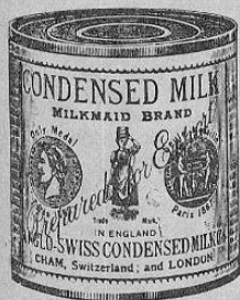
Facsimil de la lata de leche marca "La Lechera"

A los señores Médicos, Hospitales, Comerciantes, Madres de familia, y al público en general.